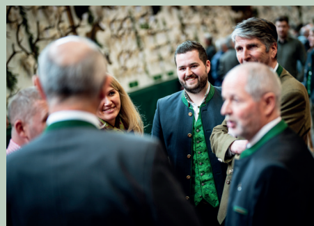
Bezirkstrophäenschau in St. Anton am Arlberg.