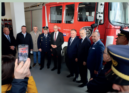
LH Anton Mattle in Zagreb: Tirol erhält für seine Unterstützung die höchste Auszeichnung des kroatischen Parlaments.