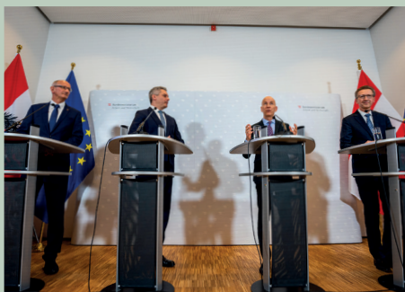
500 Millionen Euro investiert Novartis in den Standort Tirol.