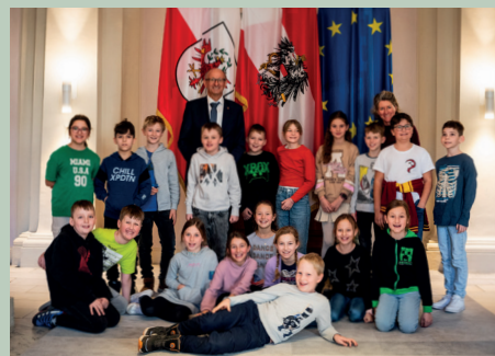
Wissen, was die nächste Generation braucht und Politik erlebbar machen.