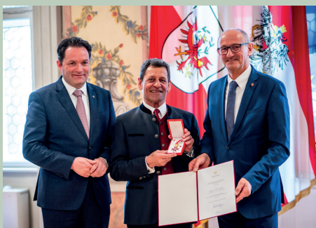
Franzl Posch erhält das Goldene Ehrenzeichen der Republik Österreich.