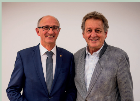
Herzlichen Glückwunsch zur beeindruckenden Wiederwahl an AK-Präsident Erwin Zangerl.