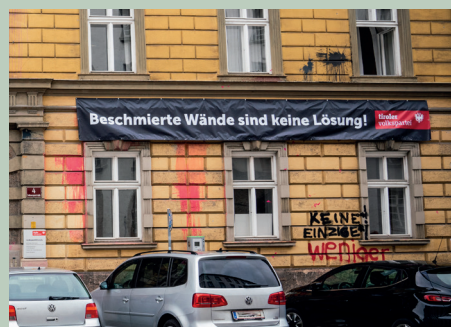
„Ist das wirklich euer Demokratieverständnis?“ - VP kontert mit Bannern Sachbeschädigungen und Beschmierungen an der Parteizentrale.