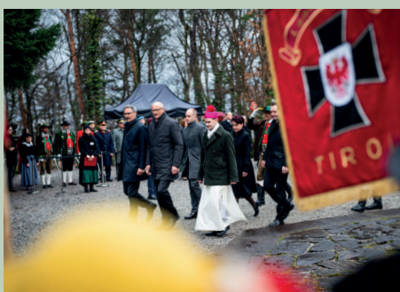
20. Februar: Andreas-Hofer-Gedenktag am Bergisel.