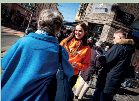
Verteilaktion anlässlich des Weltfrauentags am 8. März.