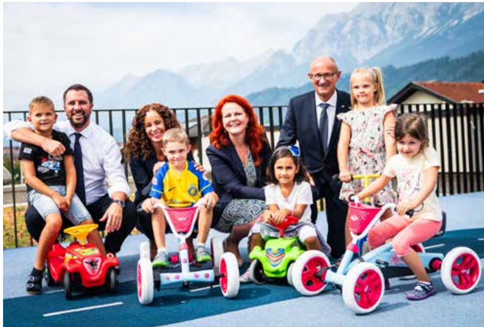
Kinder sind unsere Zukunft, deshalb verdienen sie die beste Bildung.