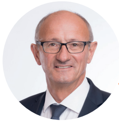
Landeshauptmann Anton Mattle

Als Regierungschef trägt LH Anton Mattle Verantwortung für alle Menschen und Gemeinden in Tirol. Die Regierung ist im ersten Jahr schon weit gekommen: