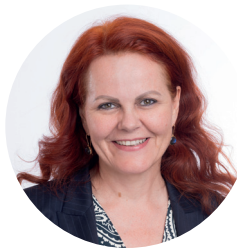
Landesrätin Cornelia Hagele

Im ersten Jahr hat Landesrätin Cornelia Hagele in ihren Ressorts Gesundheit, Pflege, Bildung, Wissenschaft und Forschung bedeutende Meilensteine erreicht. Für Hagele lag der Fokus im ersten Jahr klar darauf, die Gesundheitsversorgung zu stärken, die Bildungschancen zu verbessern und die Wissenschafts- und Forschungslandschaft in Tirol zu fördern.