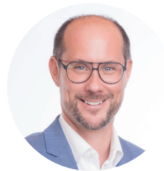
Landesrat Mario Gerber

Im Bereich Wissenschaft und Forschung wurde ein wegweisendes Wissenschaftsförderungsprogramm mit der Tiroler Wissenschaftsförderung und der Tiroler Nachwuchsförderung für die Jahre 2023 bis 2027 auf den Weg gebracht.