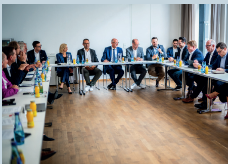
Bei der Konjunkturkonferenz in der Wirtschaftskammer zeigt sich die aktuelle Stimmung bei den heimischen Unternehmen.