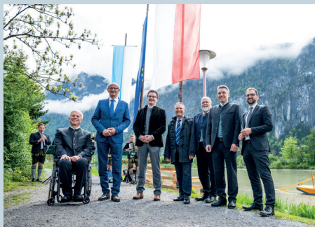
Die grenzüberschreitende Innfähre zwischen Kiefersfelden und Ebbs ist ein tolles Beispiel für grenzüberschreitende Zusammenarbeit.