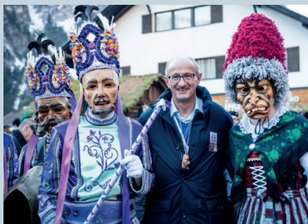
Im Februar stehen unzählige Fasnachten im ganzen Land an. Brauchtum wird hochgehalten.