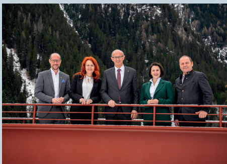
Bei der Regierungsklausur im Pitztal liegt der Schwerpunkt auf der Energiewende.