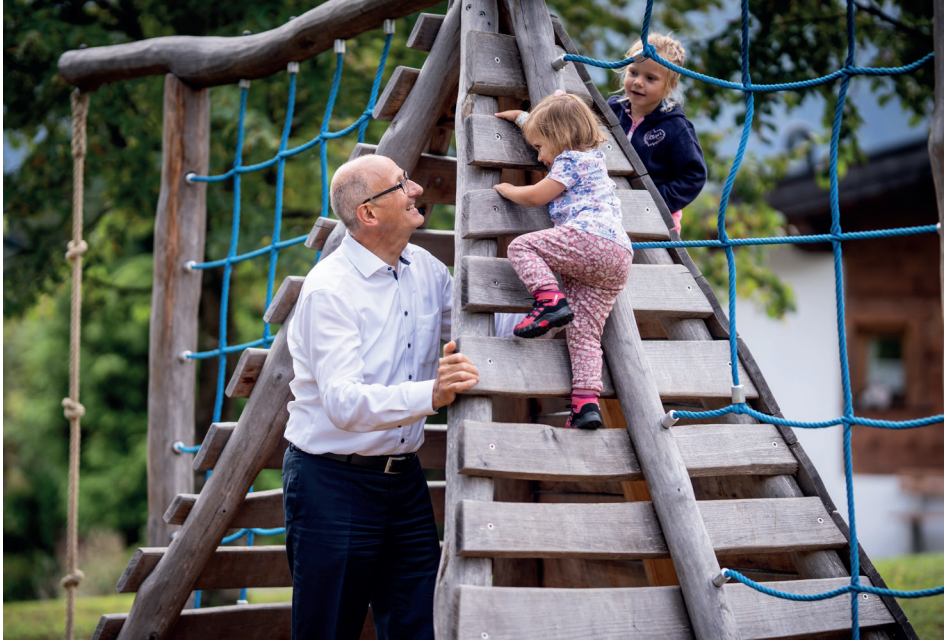
Hoch hinaus: Landeshauptmann Anton Mattle verweist auf viele Erfolge im ersten Jahr.