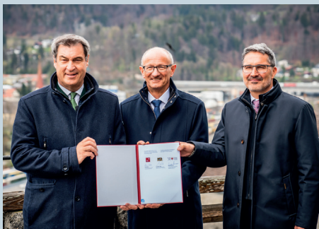
Im April unterzeichnen LH Anton Mattl, Bayerns Ministerpräsident Markus Söder und Südtirols LH Arno Kompatscher die Kufsteiner Erklärung zur Einführung eines intelligenten Verkehrsmanagementsystems.