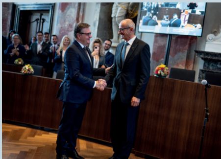
Am 25. Oktober 2022 sind die neue Tiroler Landesregierung und die 14 Abgeordneten der Tiroler Volkspartei angelobt worden.