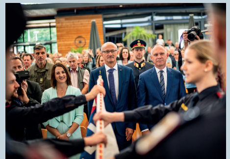
Im Landhaus wurde junge Rekrutinnen und Rekruten für den Polizeidienst angelobt.