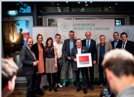
Bei der e5 Gala im Congress werden besonders umweltfreundliche Gemeinden ausgezeichnet.