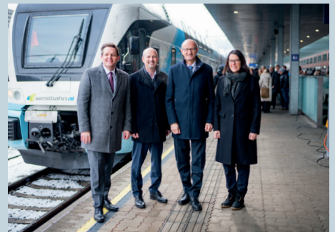
Im Dezember begrüßen wir die erste Westbahn in Tirol.