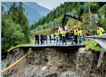
Das Hochwasser im August hat schwere Schäden angerichtet, wie hier auf der Ötztal Bundesstraße.