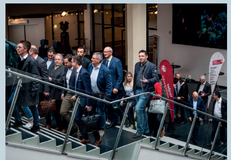
Im März lädt die Tiroler Volkspartei zur großen Gemeindegala.